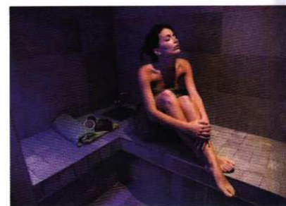
Hammam, bain bouillonnant aromatique, massage... pour une pause détente

chemin de Courmateau, 33290 Le Pian Médoc. Tél. : 05 56 70 31 31.